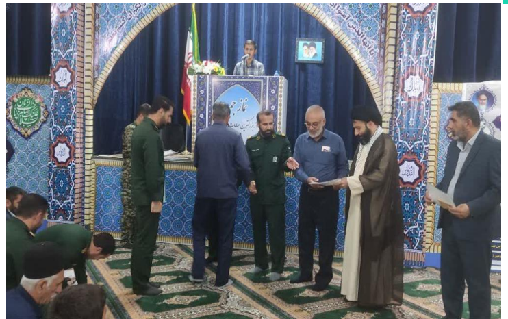
فرمانده سپاه ناحیه اندیکا در مراسم تجلیل از جهادگران گفت: گروه های جهادی در

خط مقدم خدمت به مردم حضور دارند و طرح های مختلف عمرانی و محرومیت زدایی اجرا می کنند