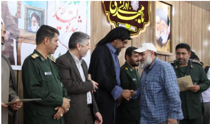
حضور جهادگران شادگان در نماز جمعه و تقدیر از مسئول سازندگی و مجمع جهادگران